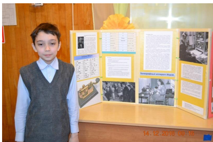
Азбука Морзе (4 класс)

Вот только несколько проектов, которые представили блестяще ребята. Авторы самого лучшего проекта были направлены к Москву для участия в одноименной конференции, которая проводится в университете им Крупской.