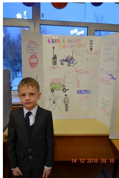
Связь в работе полиции (2 класс)

Вот только несколько проектов, которые представили блестяще ребята. Авторы самого лучшего проекта были направлены к Москву для участия в одноименной конференции, которая проводится в университете им Крупской.