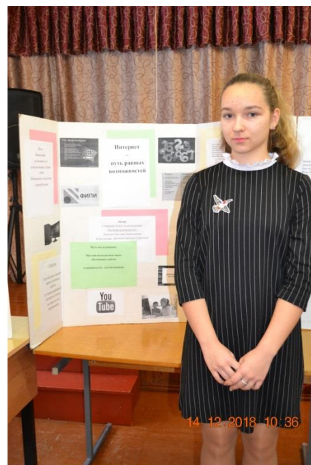
Безопасность в интернете (8 класс)