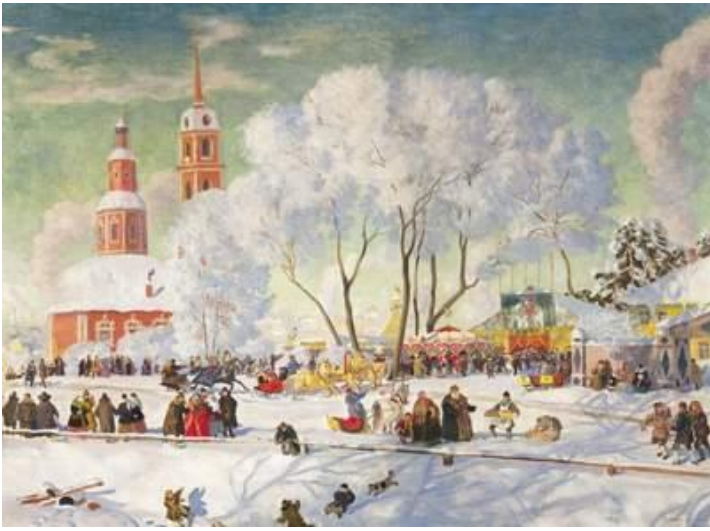
ДРЕВНЯЯ РУСЬ -празднование Нового года на Руси