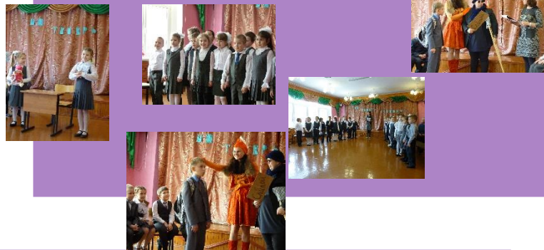
Музей «Живые системы»

Вы теперь не просто дети - вы теперь ученики!