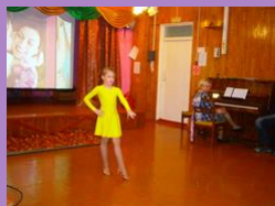
Поздравляю с Днем матери!

Мама - это значенье нежности, это тепло, доброта, Мама - это безмятежность, это радость, красота! Мама - это не только сказка, это утренний рассвет, Мама - в твой час тысласки, это мудрость и совет! Мама - это земля тепла, это свет, солнечный свет, Мама - это лучик света, мама - это значенье жизни!